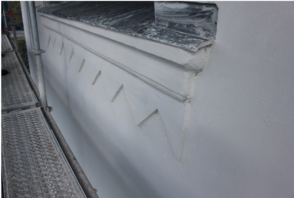
Figur 4 Sågtandad list under ljudluckan efter åtgärd.