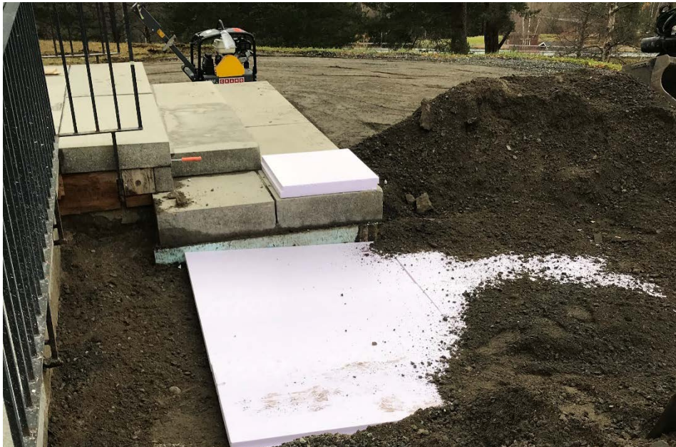
Figur 20 Kring entrén isolerades med markskivor.