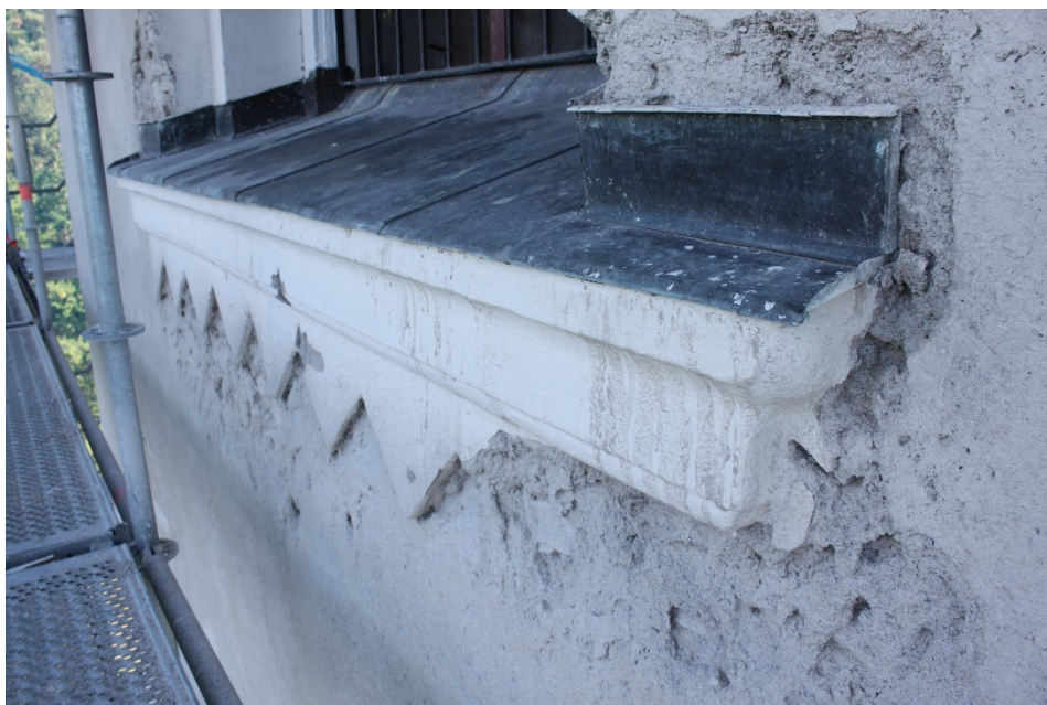
Figur 2 Sågtandad list under ljudluckan. Två tänder längst åt söder har gjorts om i samband med 2018 års arbeten. Dessa hade tidigare blivit förnyade.