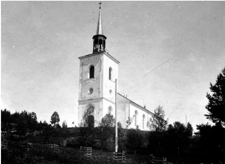
Figur 1 Undersåkers kyrka från väster.

Kring 1954 skedde en exteriör renovering av kyrkan. Enligt åtgärdsförslaget skulle: ”Alla utvändiga putsytor borstas så omsorgsfullt som möjligt så att all gammal kalkfärg avlägsnas. All frostsadad puts bortbilas omsorgsfullt varpå grundas med kalkcementbruk och putsas med samma ytstruktur som befintlig puts.”