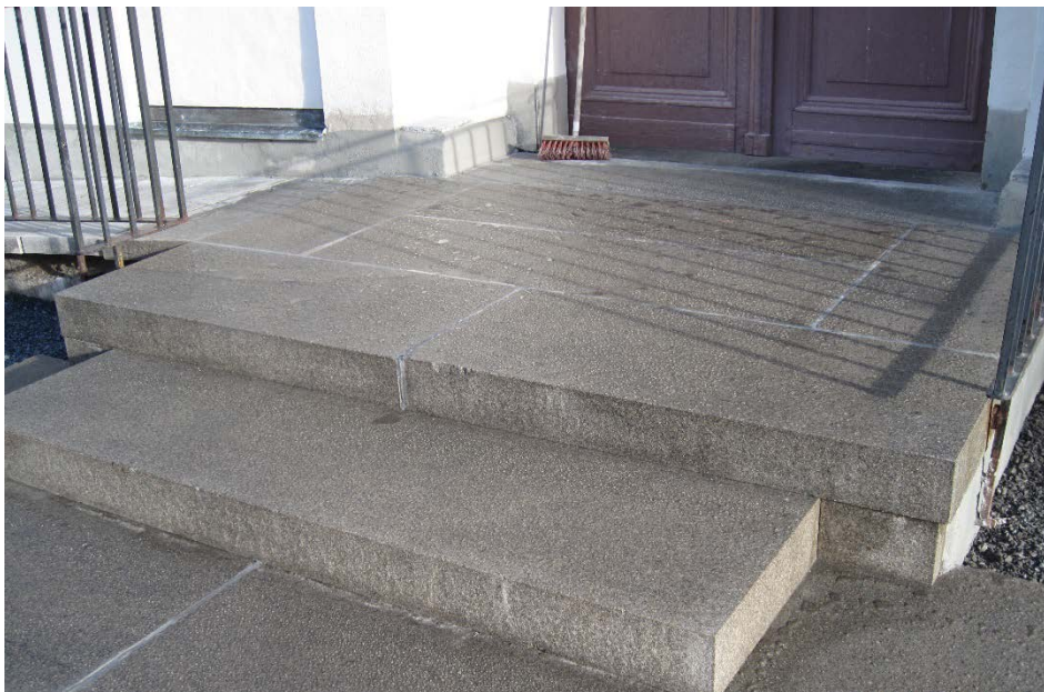
Figur 19 Trappan har behandlats med KEIM Lotexan-N för att i framtida förhindra vatten att tränga ner i konstruktionen.