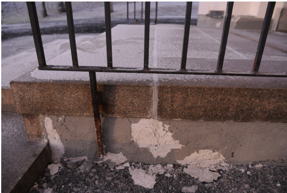
Figur 23 Trappans sidor målades en gång som skydd för putsen inför vintern. 2018-11-22 hade delar av färgen ramlat bort. Detta kommer att åtgärdas till våren 2019.