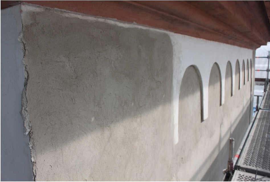
Figur 6 Rundbågsfrisen under takfotslisten behölls.