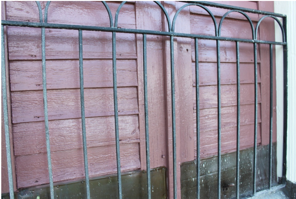
Figur 12 Spruckna brädor på ljudluckor har spacklats med linoljaespackel innan målningsbehandling.