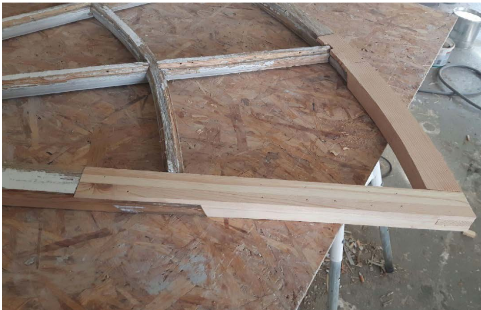
Figur 9 Delar av en båge i det nedre fönstret (nedre bågen längst åt söder) var deformerad och har lagats i med nytt virke.