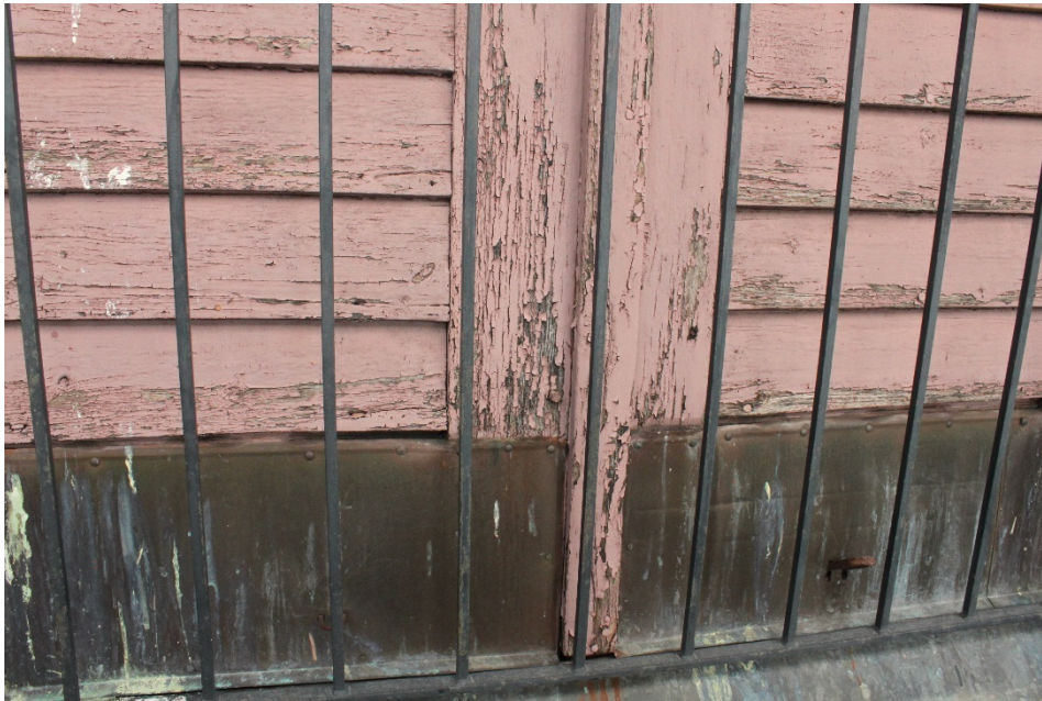
Figur 11 Ljudluckorna var i stort behov av målningsbehandling.