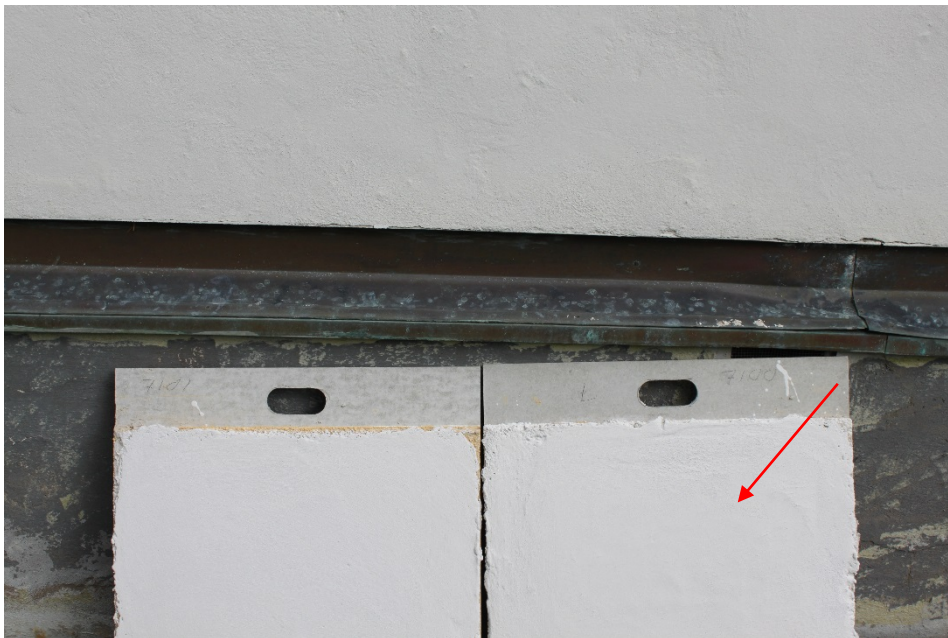
Figur 13 Utifrån provkarta togs två kulörer fram för uppstrykningsprover till fasadens kulör (Nr 7000 och 7001 från Målar kalk). Dessa målades upp på putsade skivor. Den som lög närmast den befintliga fasaden var Nr 7000, som också kom att användas.