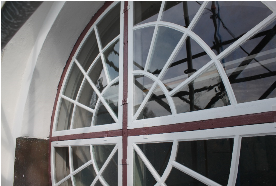
Figur 10 Till fönsterkarm har linoljefärg i vit kulör (NCS S 0500 N) från Engvall och Claesson använts. Den rödbruna kulören till fönsterbågar och ljudluckor har brutits fram på plats med utgångspunkt av kulör NCS S 5020-R.