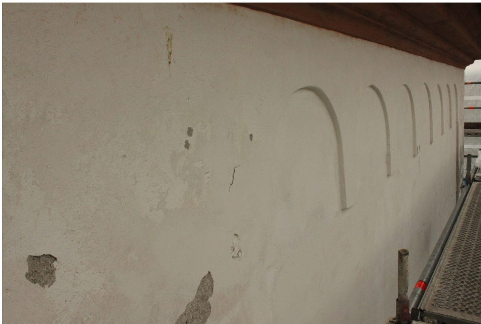
Figur 5 Rundbågsfris under taklisten före åtgärd.