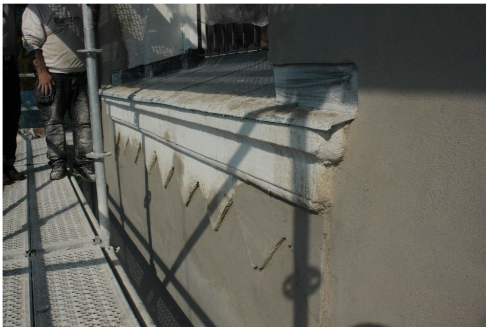
Figur 3 De nya tänderna formades för hand utan mall, för att få lite mjukare former som stämmer överens med de övriga.