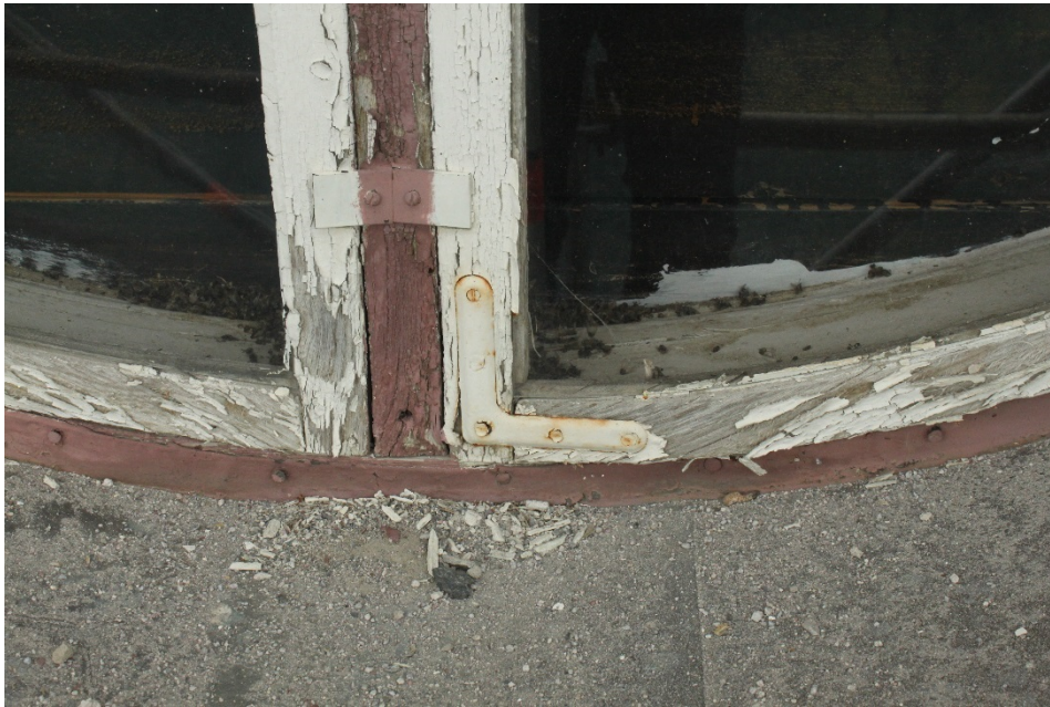
Figur 8 Fönstren var i behov av målningsbehandling.