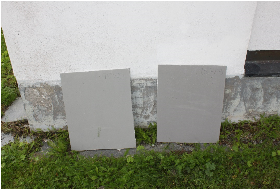
Figur 14 För sockeln togs två kulörer fram för uppstrykningsprover 9523 (till höger) och 9543 (till vänster) från KEIM. Liksom för fasaden, målades dessa upp på putsade skivor.