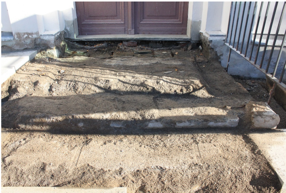
Figur 17 Trappan sedan trappstegen plockats bort.