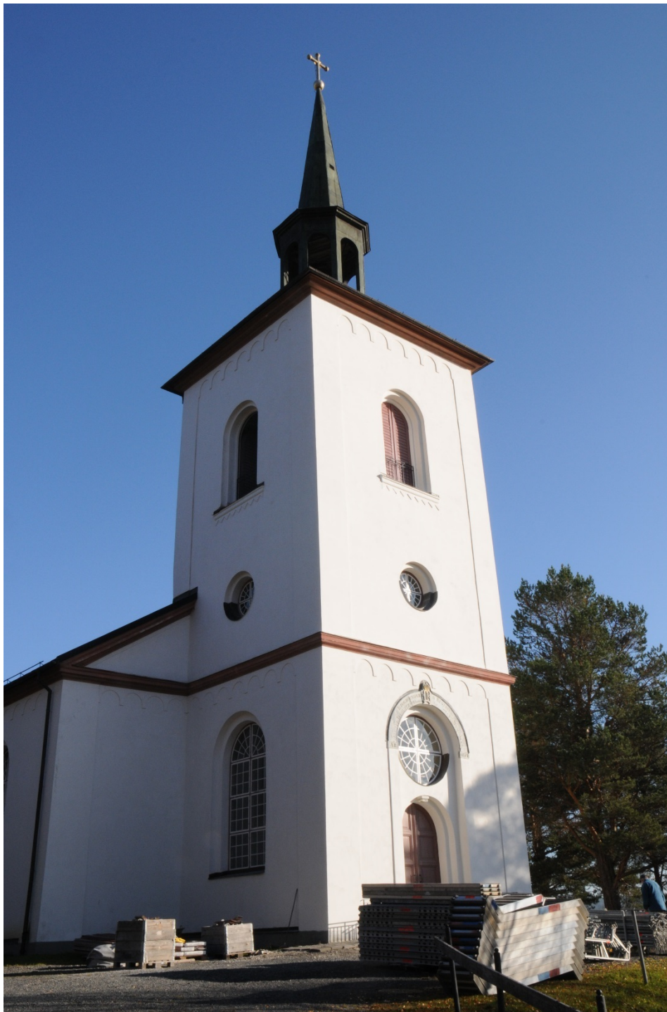
Figur 24 Undersåkers kyrka 2018-10-12