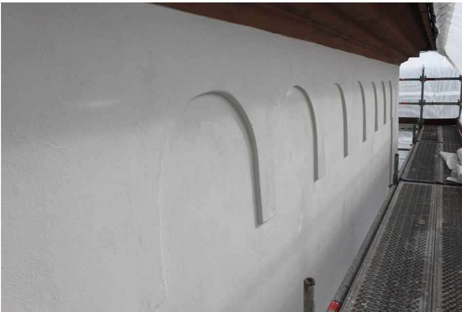
Figur 7 Rundbågsfrisen under takfotslisten efter ansfärgning.