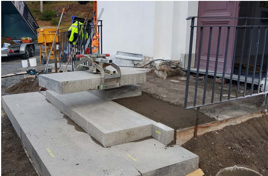
Figur 18 Trappan har blivit omsatt i jordfuktig betong.