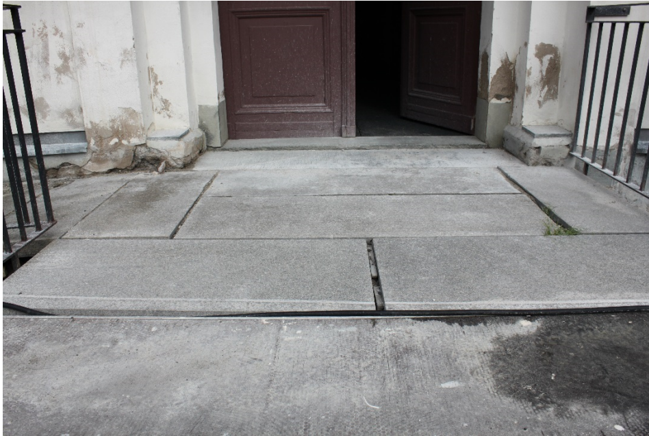
Figur 16 Stenarna i trappan hade kommit ur läge på grund av att vatten trängt in.