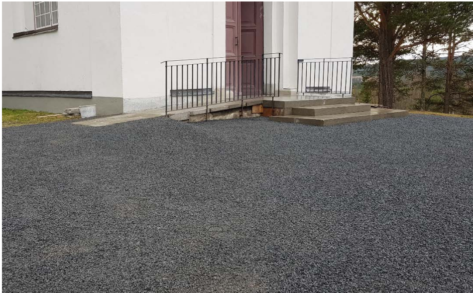
Figur 22 Markarbeten framför entrén färdigställda.