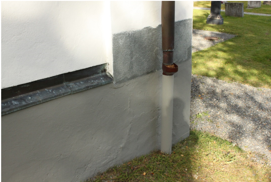
Figur 15 Till sockeln valdes 9523 från KEIM.