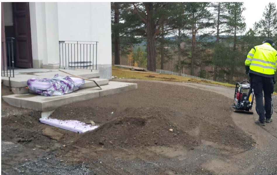
Figur 21 Området kring trappa och ramp har fyllts upp med grus.