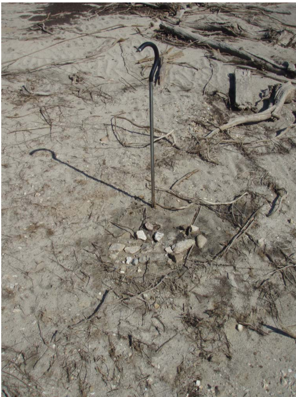
Kall 656. Vid sonden är en härd av förhistorisk karaktär.