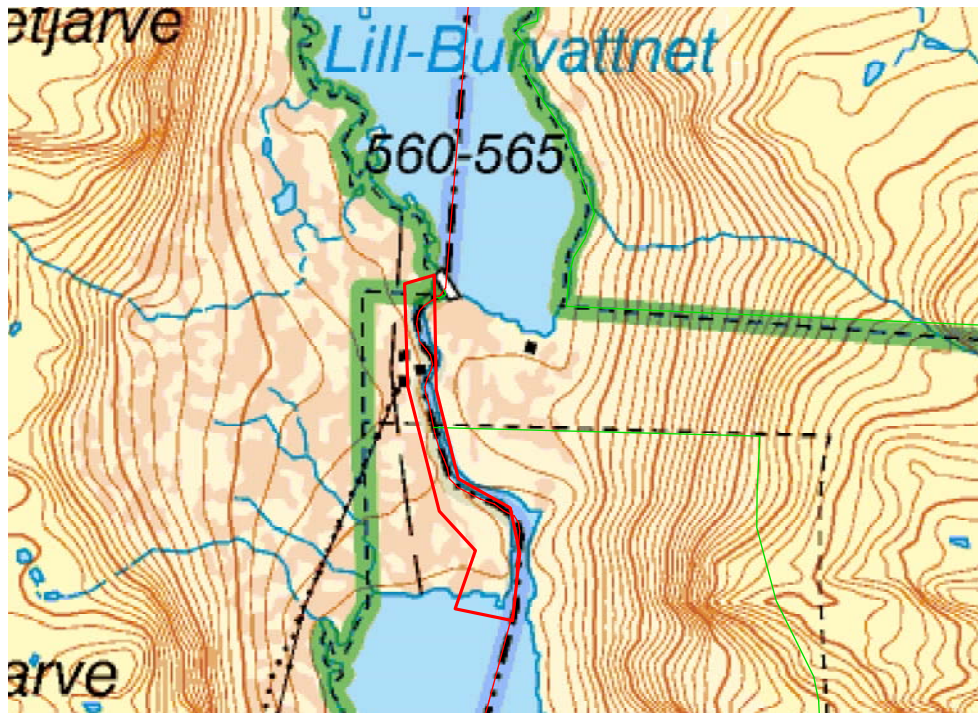
Arbetsområdet inringat med rött.

Arbetsområdet har avgränsats utifrån de kartor över planerade ingrepp som tillhandahållits av vattenregleringsföretaget. Planerade ingrepp utgörs av förlängning av vägen ned mot Mjölkvattnets strand samt uttag av sten och morän både på stranden i söder men även i den grusås som löper mellan de båda sjöarna (väster om ån). Efter diskussion med regleringsföretagens representant bestämdes att inventering skulle ske längs hela vägsträckningen eftersom det kommer att bli verksamhet längs hela denna.