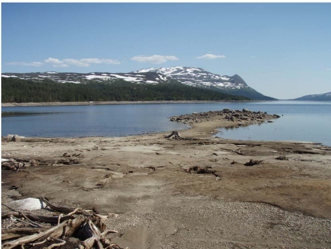
Kall 658. Stenåldersboplats som sträcker sig ut mot näset.