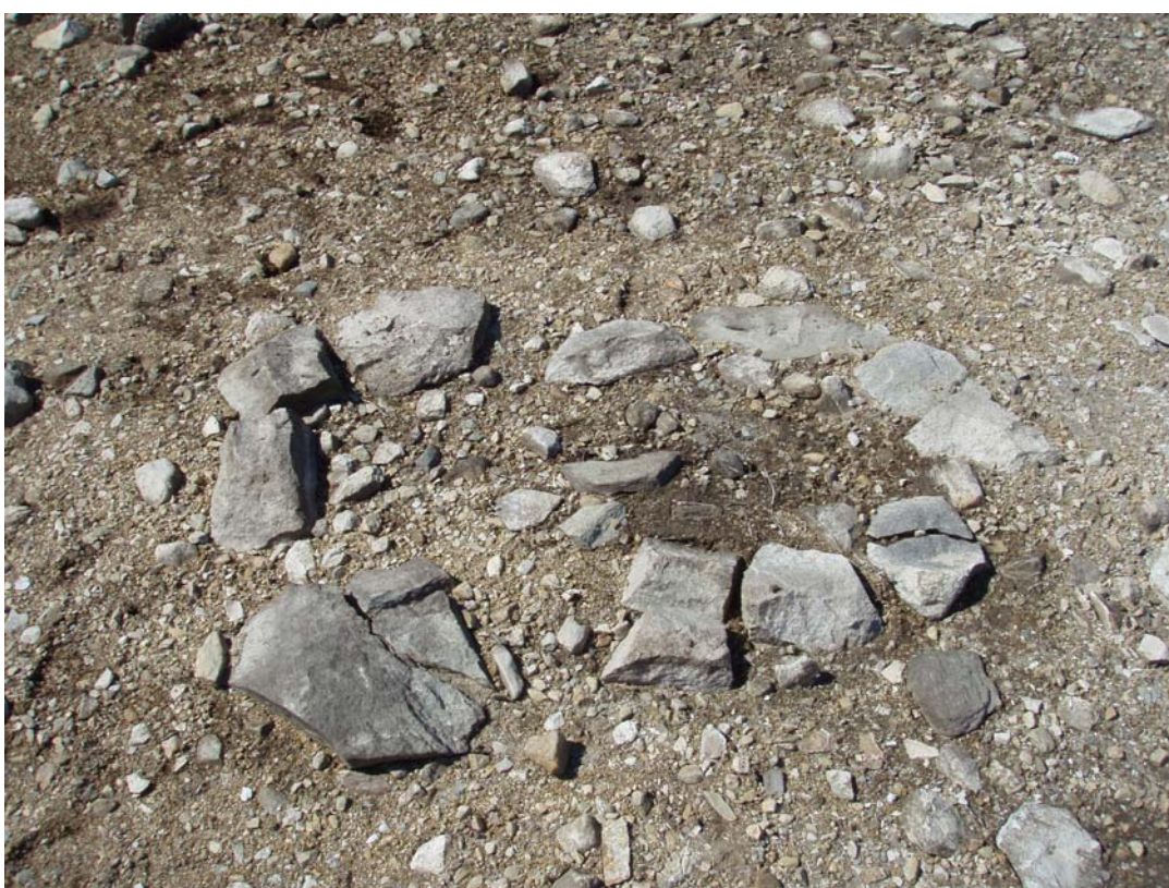
Kall 659. Härd som sannolikt varit i en kåta.