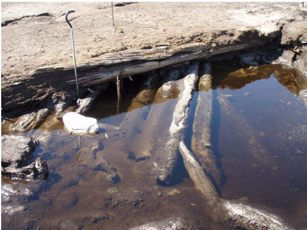
Kall 657. Plattformen är delvis täckt av ett 0,5 meter tjockt torvlager.