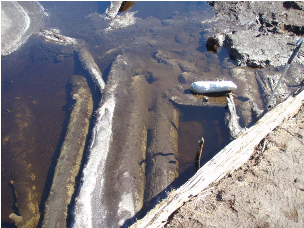
Kall 657. Plattform av okänd funktion. Möjligen kan den sättas i samband med bärning av myrmalm.