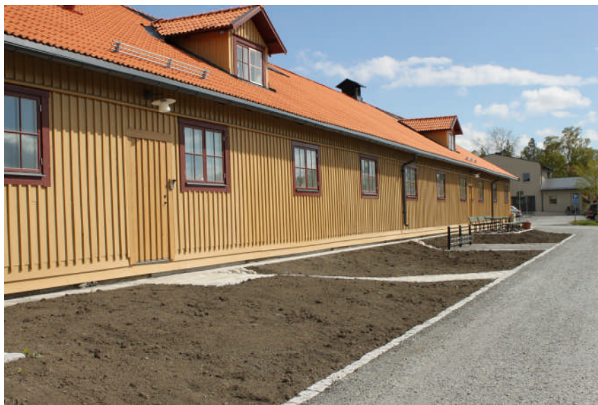
Ytterligare tre nya dörrar har tagits upp på den västra fasaden

En branddörr som nyupptogs under 2008-2009 har flyttats 14 meter norrut på den västra fasaden. Ytterligare en utrymningsdörr sattes in under 2011 på den västra fasaden, ca 40 meter från vägghörnet mot söder. Vid besök på plats 2012-06-01 konstaterades att sammanlagt tre nya dörröppningar tagits upp 2011. Dörrarna är utförda lika befintliga och enligt ritningar.