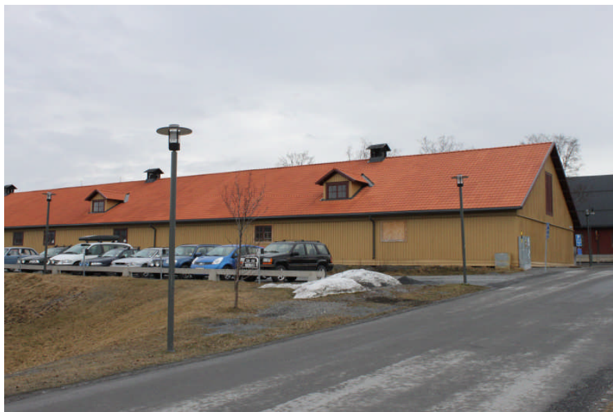
Fasad mot väster, före det att ett flertal nya fönsteröppningar tas upp

Även ytterligare fönster har tagits upp på fasaden i väster nära vägghörnet mot söder, detta har skett i samband med att dessa lokaler inretts till kontor.