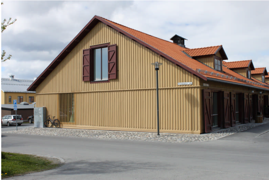
Nyupptagna fönsteröppningar, fasad mot söder