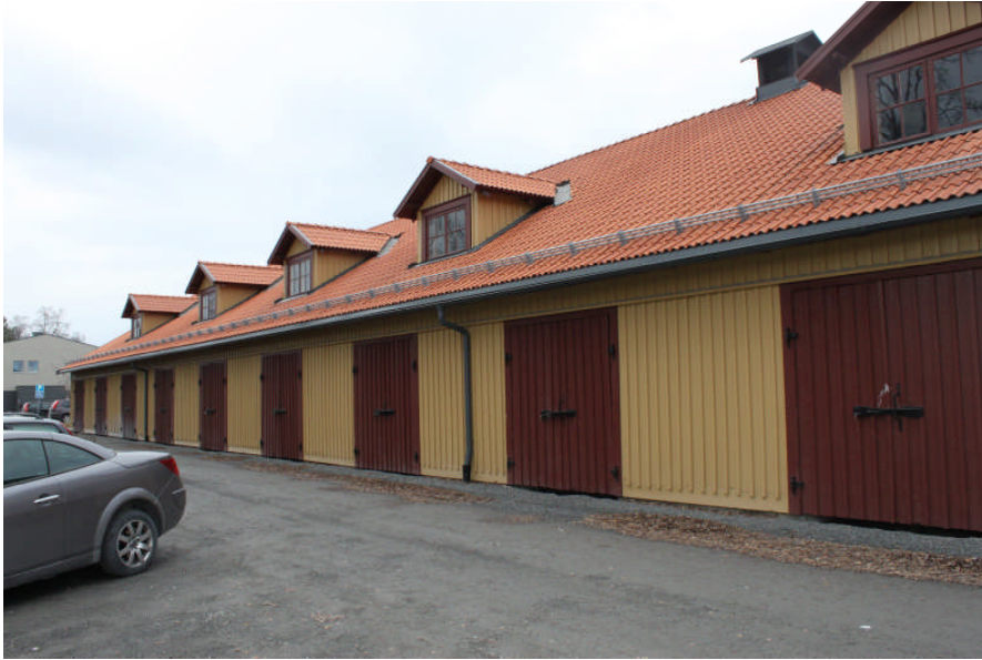
Före åtgärd, östra fasaden