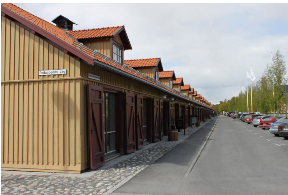
Efter åtgärd, asfaltering, kullersten och betongplattor längs med byggnadens östra fasad