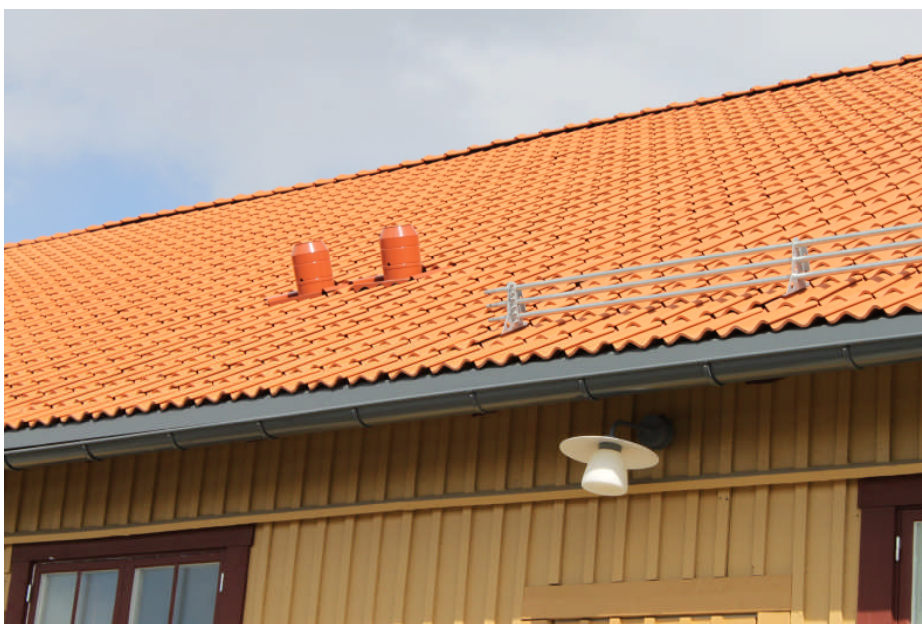
Mindre huvar har monterats på taket