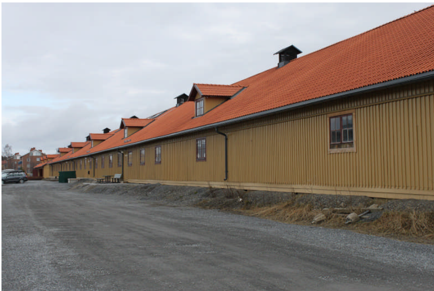
Före åtgärd, fasad mot väster

På byggnadens västra långsida har man liksom på östra sidan lagt fyrkantiga grå betongplattor längst in mot byggnadskroppen. Utanför dessa tar en slänt vid som planats ut och man har sått gräs. Ut mot körytan har man lagt gatsten. Tre stycken uteplatser har ordnats samt en lastkaj.