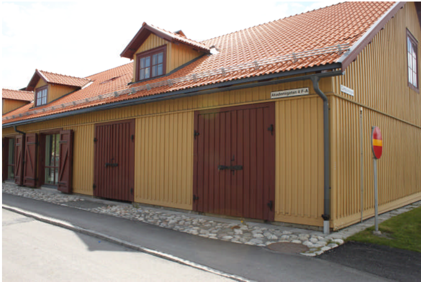
Östra fasaden mot norr, två portöppningar har ännu inte glasats in