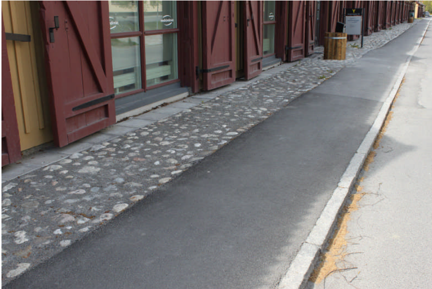
Efter åtgärd, östra fasaden

På byggnadens västra långsida har man liksom på östra sidan lagt fyrkantiga grå betongplattor längst in mot byggnadskroppen. Utanför dessa tar en slänt vid som planats ut och man har sått gräs. Ut mot körytan har man lagt gatsten. Tre stycken uteplatser har ordnats samt en lastkaj.