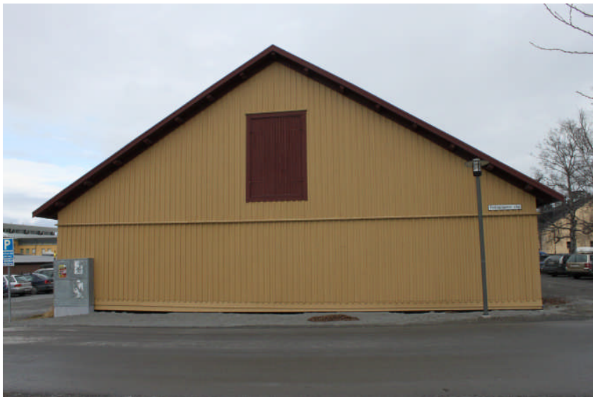
Före åtgärderna utförts, södra fasaden.

En kvadratisk fönsteröppning på bottenvåningen har tagits upp på byggnadens södra kortsida. Locklisterna har behållits och de täcker därmed fönsteröppningen vilket gör att det nya fönstret inte blir allt för dominerande i fasaden. Enligt programmet skulle detta även göras på den norra fasaden, men eftersom det inte har flyttat in några hyresgäster där än så har detta inte utförts ännu.