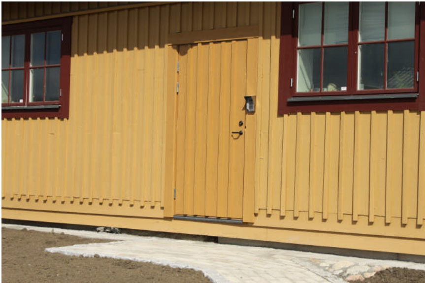
Nedersta brädan på sockelpanelen är monterad

Panel på förvandring har åtgärdats. Innan ombyggnaden 2008-2009 var sockelpartiet klätt med två panelbrädor på förvandring. I kontrollrapporten från denna restaureringsomgång redogjorde man för att den understa brädan tagits bort. Detta gjorde att grunden blottades. Nu har detta återställts och man har även fyllt upp med grus, vilket gör att man ej längre ser grundkonstruktionen.