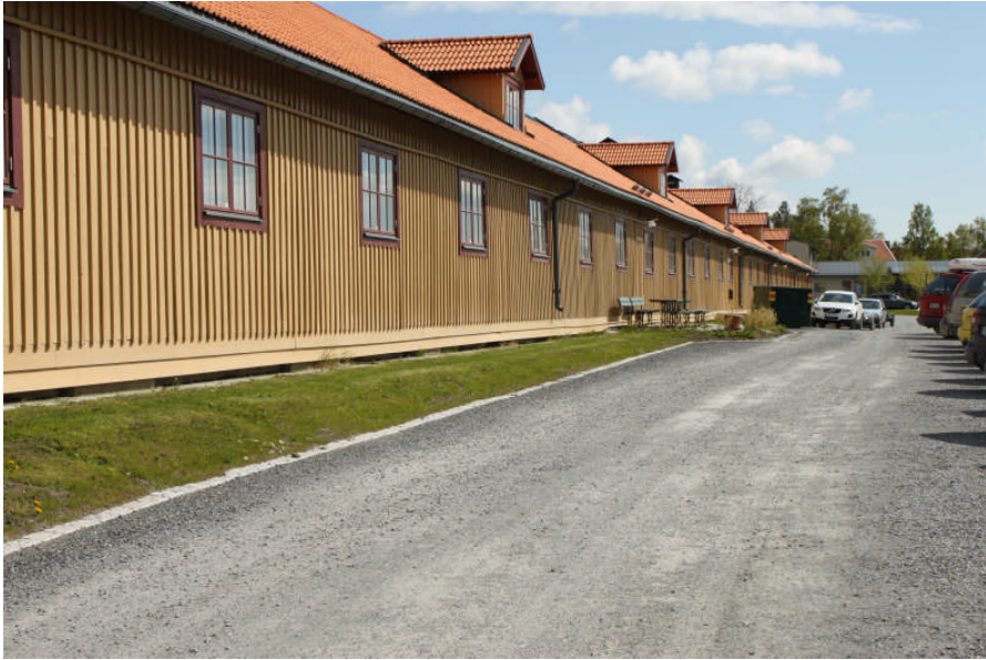
Slänten har planats ut och gräs har anlagts, byggnadens västra sida