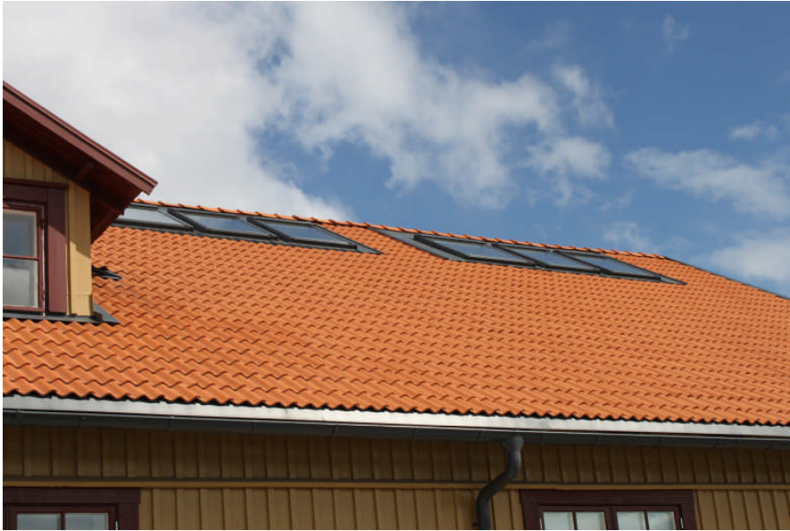
Nya takfönster på takfall mot väster