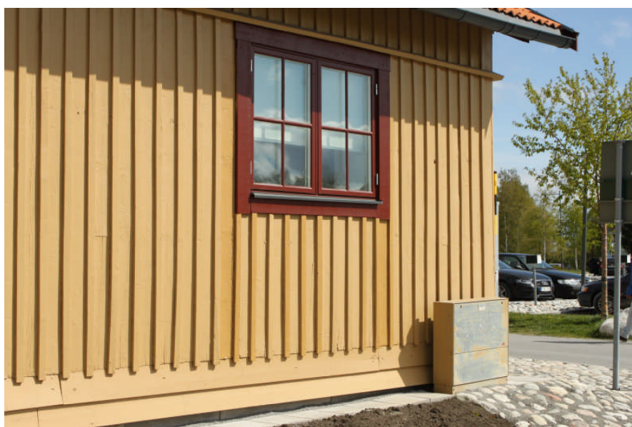
Ett av de nyinsatta fönstren, fasad mot väster

Nyinsatta fönster och nygjorda dörrar har målats i lika kulörer som befintliga, NCS S3030-Y20R (varmgulbeige) för fasader och NCS S6050-Y80R (engelskt röd) för fönster. Eftersom färgen på fasader och dörrar