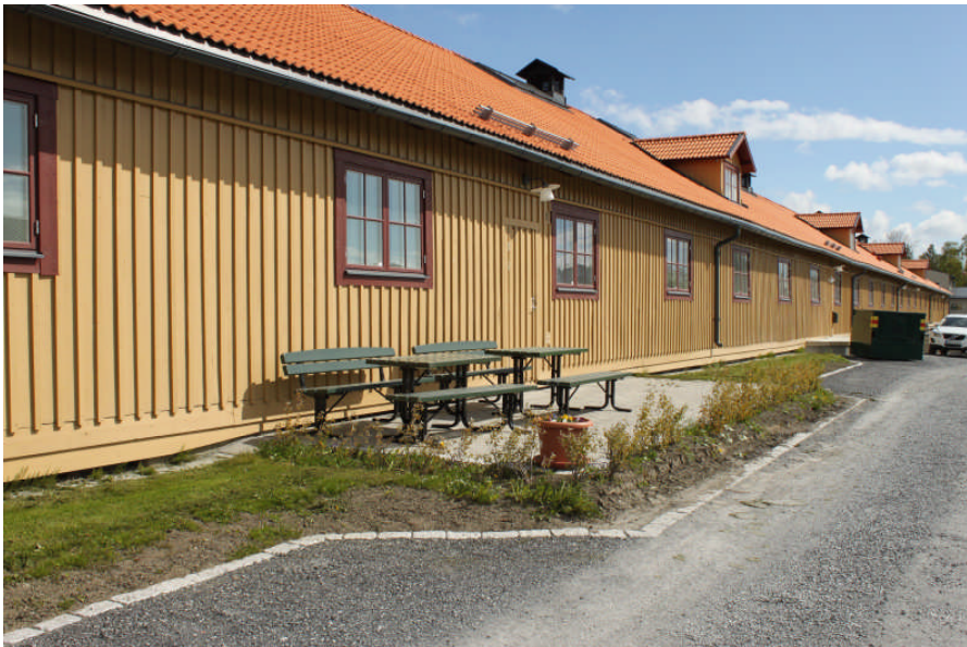
En av uteplatserna