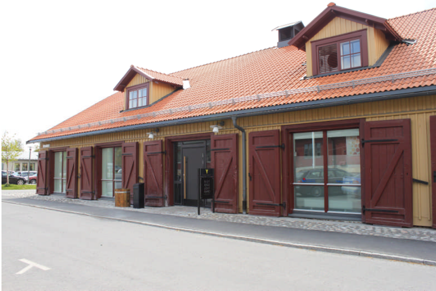
Fasad mot öster, åtgärden är utförd, ytterligare portingångar har glasats upp